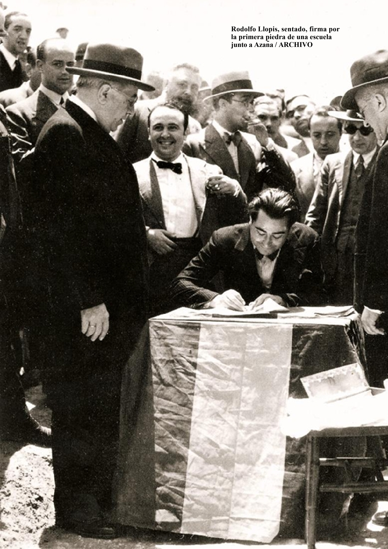
Rodolfo Llopis, sentado, firma por la primera piedra de una escuela junto a Azana