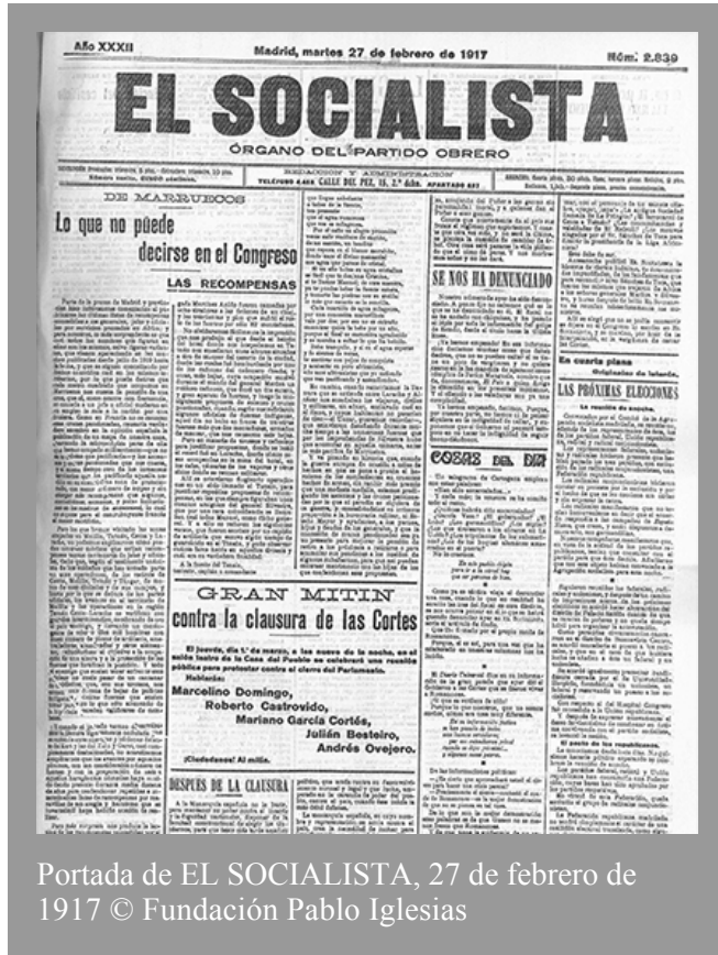
Portada de EL SOCIALISTA, 27 de febrero de 1917