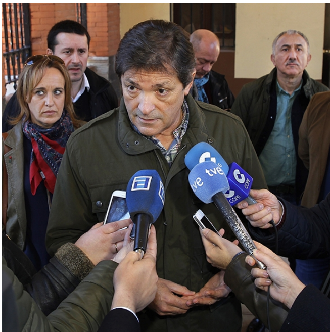
El presidente de la gestora, Javier Fernández