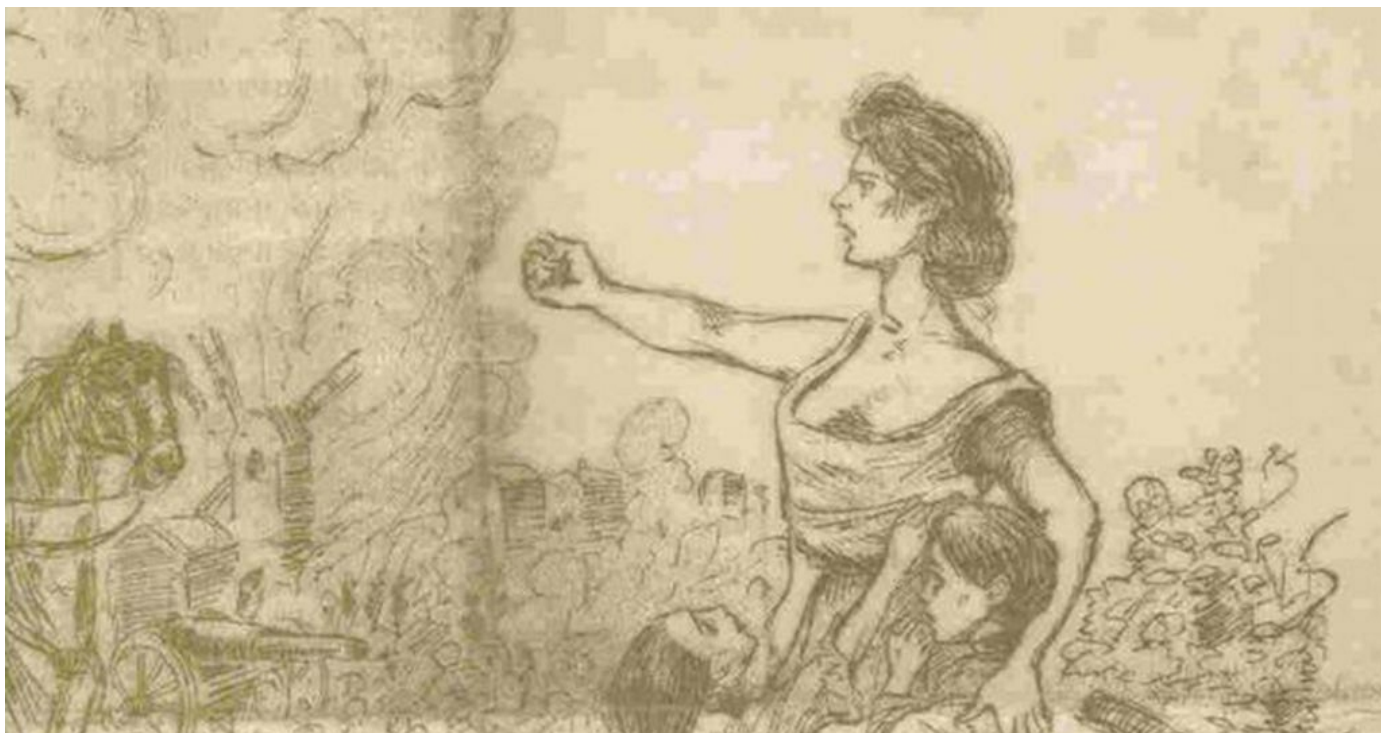
Micaela Chalmeta en un dibujo del libro de Montserrat Duch i Planas