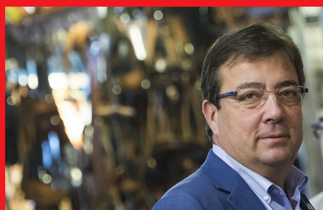
El presidente de la Junta de Extremadura, Guillermo Fernández Vara

El jefe del Ejecutivo autonómico ha realizado estas declaraciones en Villareal de San Carlos donde ha inaugurado la XII Edición de la Feria de Turismo Ornitológico, FIO 2017. Allí, Fernández Vara, ha reflexionado sobre el potencial del sector turístico de nuestra región, subrayando que tenemos que ser conscientes de que el turismo es un ámbito en el que se va a producir un incremento muy notable en los próximos años. "Bien haríamos en pensar en